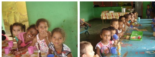
CRIANÇAS DA ESCOLA RURAL