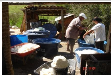
COMUNIDADE PREPARANDO PARA FAZER FARINHA